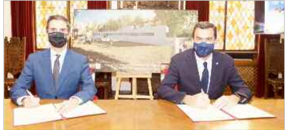
El primer edil complutense firmó el convenio junto al presidente de la Confederación Hidrográfica del Tajo, Antonio Yáñez Ciudad

ver la luz” y destacó que “estamos ante un organismo clave a la hora de cuidar de nuestros ríos, de nuestros sistemas fluviales, pero también para promover la necesidad e importancia de los ríos y el ciclo del agua, acercando a la población a sus ríos y los valores medio ambientales y de sostenibilidad” .