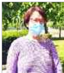
Teresa López Hervás, portavoz de Unidas Podemos

Llegó el 25 de Noviembre, Día Internacional de la Eliminación de la Violencia contra la Mujer y no llega para decirnos que este año hemos logrado hitos en el concepto que se defiende en este día. Ha sido un año en el que el machismo ha seguido imperando: 37 mujeres asesinadas desde enero de 2021, de las cuales 10 de ellas ya no convivían con su agresor. Y estos crímenes han dejado a su vez un total de 24 menores de edad huérfanos. Los datos no los digo yo, son estadísticas del Ministerio de Igualdad. Datos públicos al alcance de todas que dan escalofríos. Te pones a comparar con otros años desde 2013 y se puede observar que la tendencia este año ha ido decreciendo, no obstante han sido hasta ahora treinta y siete vidas robadas por el machismo. Los datos decrecientes nunca podrán ser buen indicador, un buen indicador será la ausencia de datos.