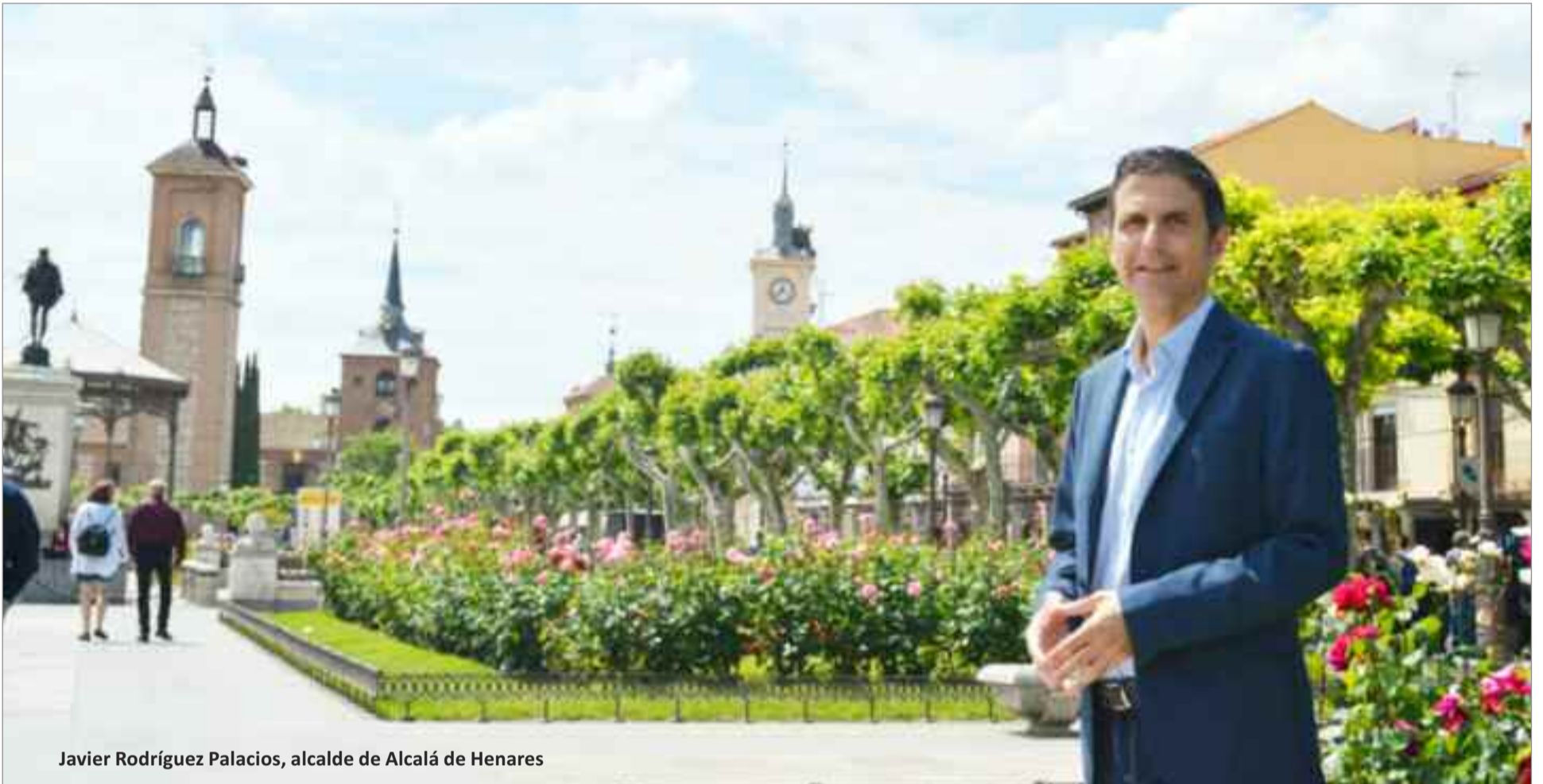
Javier Rodríguez Palacios, alcalde de Alcalá de Henares

El alcalde de Alcalá de Henares, Javier Rodríguez Palacios, participó en Baeza en la Presentación del “Plan Impulsa Patrimonio” puesto en marcha por el Ministerio de Industria, Comercio y Turismo.