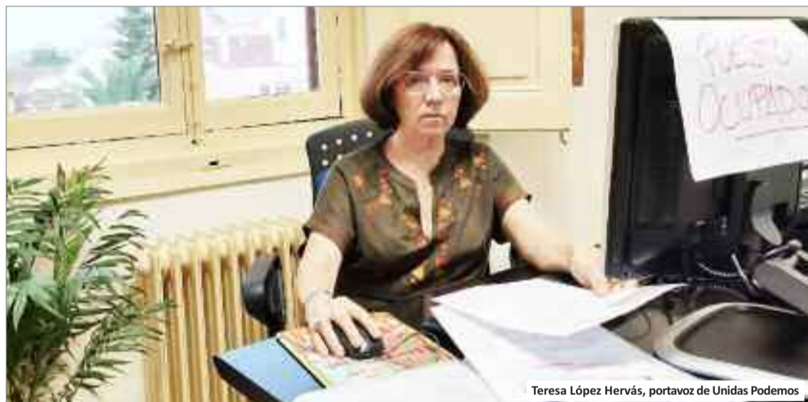
Teresa López Hervás, portavoz de Unidas Podemos

características importantes a tener en cuenta a la hora de elegir qué plantar en la ciudad. El aumento de la diversidad local va ligado a la presencia de arbolado urbano. Es importante recordar los beneficios de estas plantas de tronco leñoso que disminuyen la contaminación y mejoran la salud del entorno.